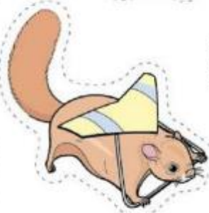
大赤鼯鼠 Fleming's flying squirrel