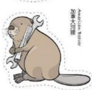
加拿大海狸 American Beaver