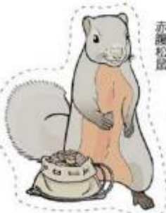
赤腹松鼠 Red-bellied Tree Squirrel