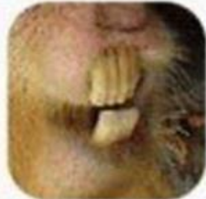
不斷生長的大門牙