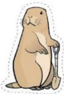
黑尾草原犬鼠 Black-tailed Prairie Dog