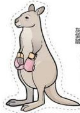
灰袋鼠 Eastern Grey Kangaroo

「鼠」是大家耳熟能詳的動物，除了大家印象中的形貌，屬於啮齒類動物的「鼠」輩們，外型或生態習性非常多樣。