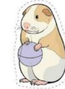
天竺鼠 Guinea Pig